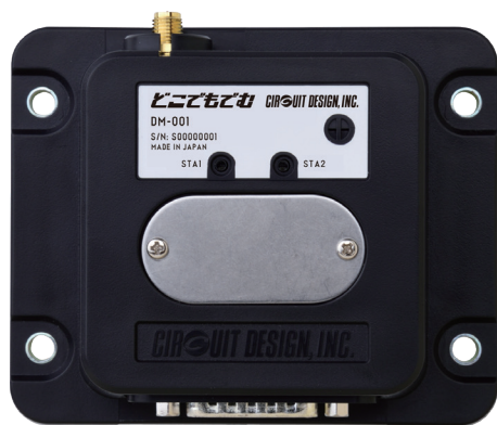
サンプル出荷予定